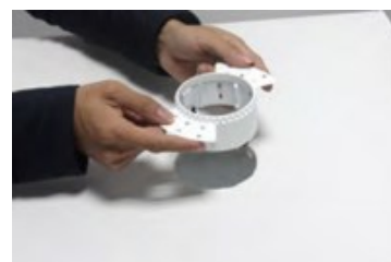
1. Couper une installation correcte dans le panneau du plafond.